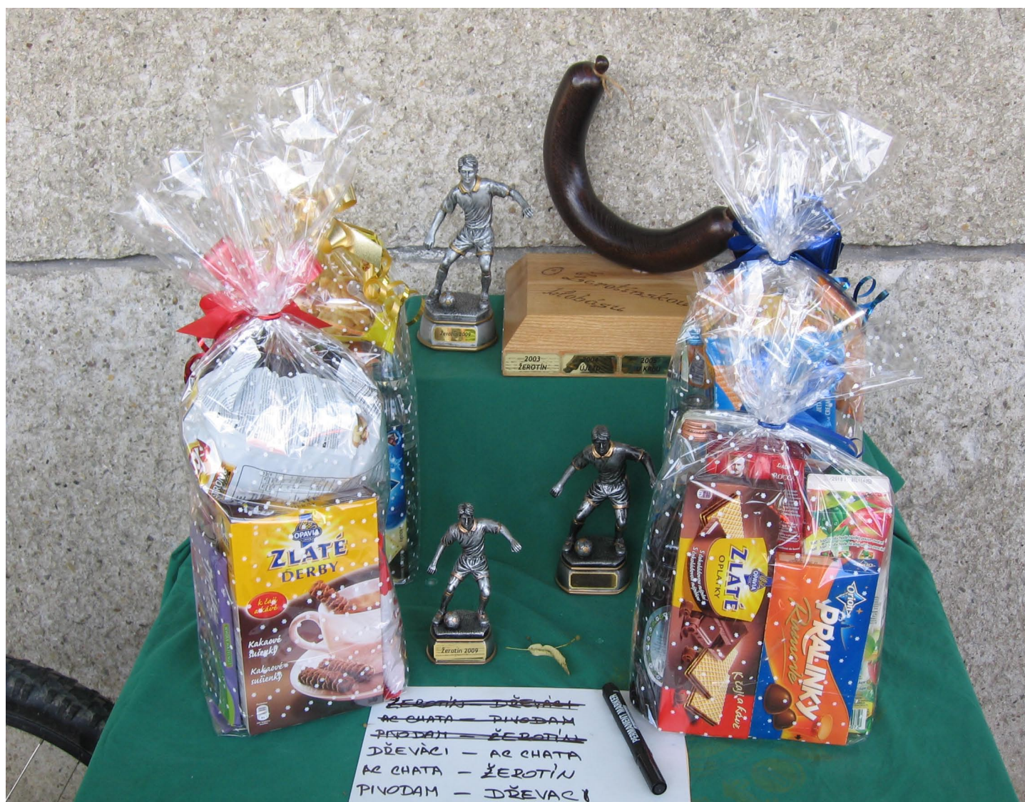
Ceny udělované na 11. ročníku hodovního turnaje v malé kopané „O putovní klobásu“

Vydává: Obec Žerotín • Žerotín 13, Litovel 784 01 • Registrováno u MK pod značkou: EČ MK ČR E 17321 • redaktor: Jiří Němec • Redakce telefon: 588 517 386 mobil: 724 738 032 • email redakce: redakce.zerotin@seznam.cz • Názor autora článku nemusí být nutně názorem vydavatele, do textu autora nezasahujeme. Uzávěrka příštího čísla: 15. 12. 2009